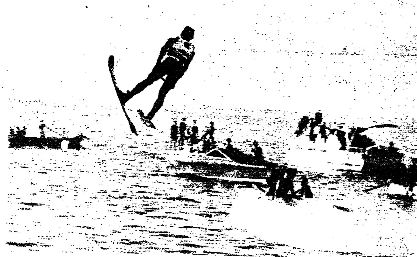
اللبناني الكر شجيسا في محاولته الاولى بالتزلج لكنه فشل بها وسقط في المياه

وفي الرابعة والربع وصل وزير السياحة ، راعي المهرجان ، فاستقبله اعضاء اللجنة المنظمة وافتتح المهرجان بالنشيد اللبناني بينما كانت احدى الفتيات تحمل العلم اللبناني وهي على مزاجها تطوف على سطح البحر نصي الجماهير ، كما كانت الزوارق البخارية عابرة نطفا حول منطقة السباق . وبعد ذلك بدأت الاستعراضات التي تأتمت بها فتيات بعمر الزهور فتمن عدة لرحلات رائعة . وتنوعت المشاهد : ثلاثة شبان يحملون ثلاث فتيات يؤدون بعض الحركات الخفيفة ، على شكل اهرامات . كذلك مشهد ثالث لشبايفين يحملان فتاتين بين فراعصهما ، وهن يهزرن كموج البحر . وفي الاياب تغير المشهد واصبحت